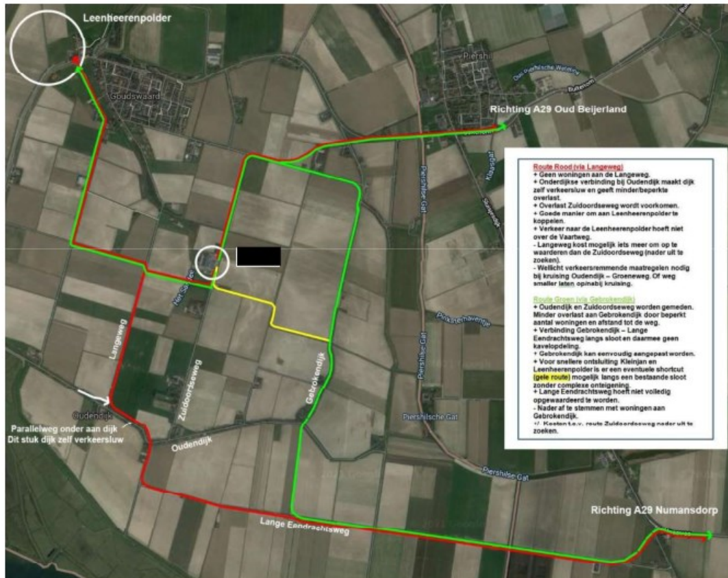
Afbeelding 1: Alternatief voorstel bewoners van de [redacted]

In de afgelopen maanden heeft APPM in opdracht van de gemeente het proces begeleid om te komen tot een gedragen voorstel voor verbetering van de verkeersontsluiting in de zuidwestelijke Hoeksche Waard. Na de tweede participatieavond hebben diverse bewoners van de [redacted] een alternatief voorstel (zie afbeelding 1) aan fractievoorzitters van de gemeente gestuurd.