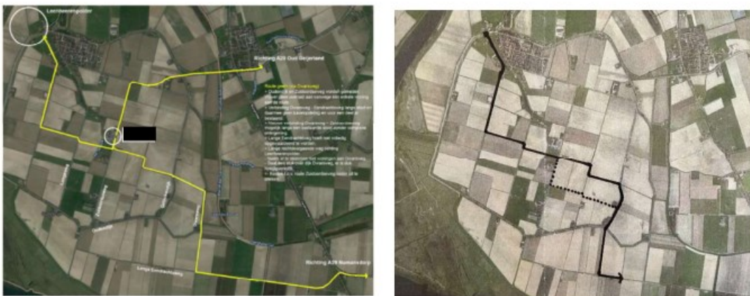
Afbeelding 2 en 3: Varianten op alternatief voorstel in afbeelding 1

Tijdens deze aanvullende gesprekken werd duidelijk dat de direct betrokkenen zeer betrokken zijn en graag meedenken over mogelijke oplossingsrichtingen. Voor, tijdens en na de gesprekken zijn nog enkele nieuwe varianten op het alternatieve voorstel gepresenteerd (zie afbeelding 2 en 3 hieronder). Daarbij zoeken de direct betrokkenen naar een oplossingsrichting die zo min mogelijk hinder veroorzaakt in de directe omgeving. Dit resulteert in een alternatief voorstel dat via de Dwarsweg over geheel nieuwe oost-westelijke infrastructuur wordt aangehaakt op de Kruisweg.