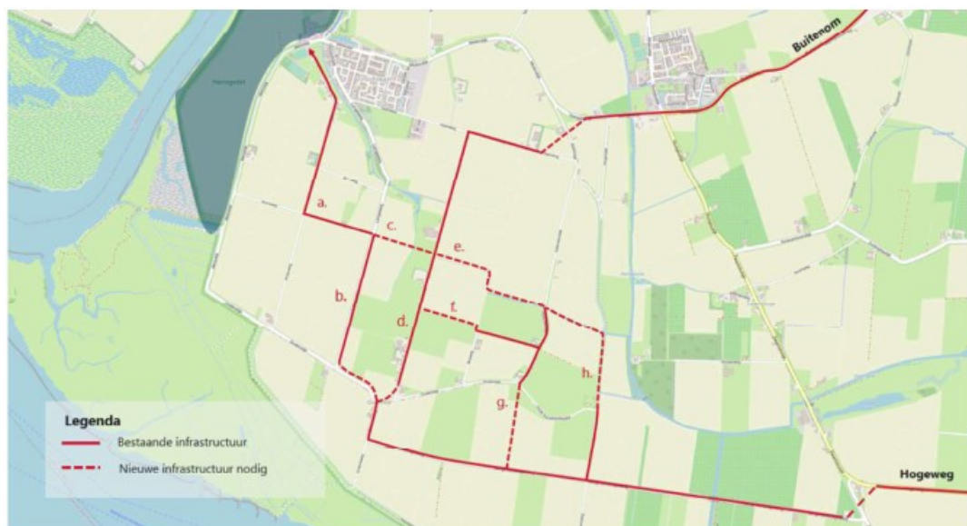
Afbeelding 4: Verschillende varianten middengebied