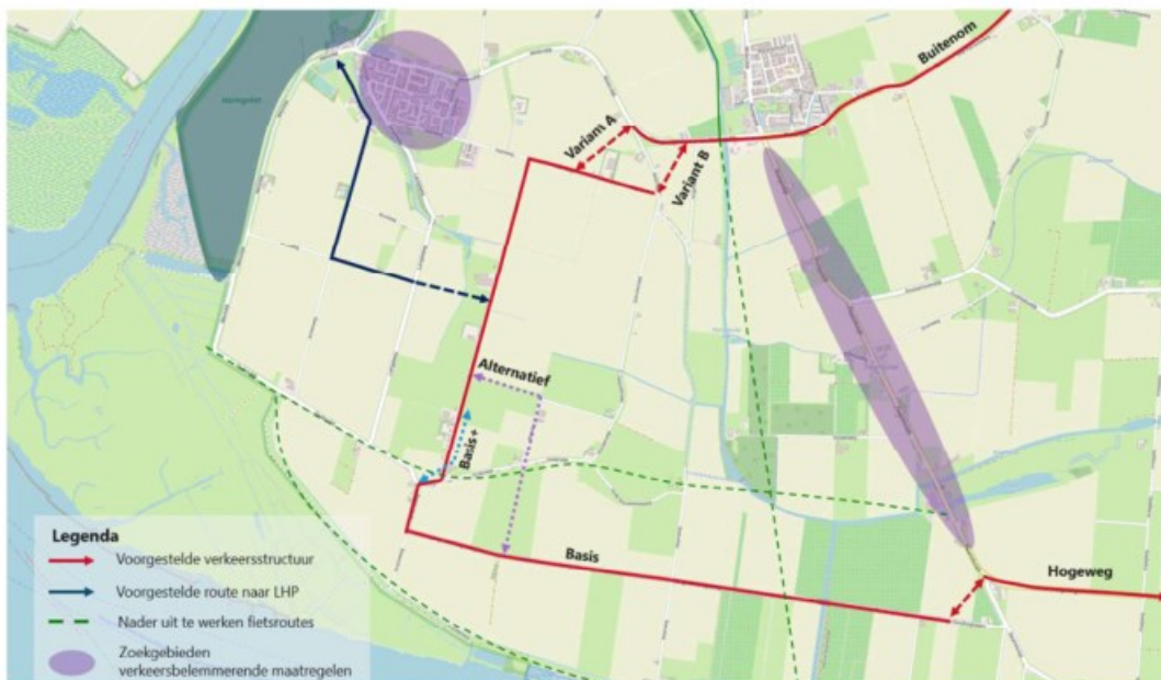
Afbeelding 5: Nader te onderzoeken varianten

Voorgesteld wordt om drie varianten in de omgeving van de Zuidoordseweg-Oudendijk nader te onderzoeken (conform werkwijze Korteweg) op inpasbaarheid (schetsontwerp) en globale kosten (zie ook afbeelding 5):