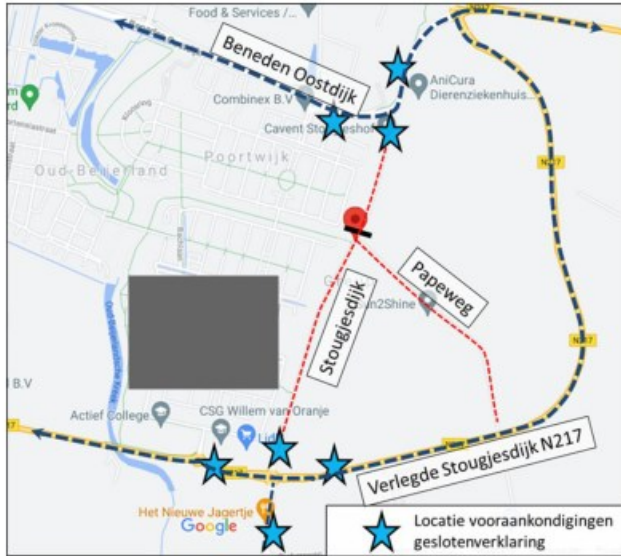
Afbeelding 1: Stougjesdijk en route via N217

Een uiteenzetting van het proces dat nadien heeft plaatsgevonden is opgenomen in de separaat bijgevoegde notitie 'Verkeer historie Stougjesdijk' d.d. 1 december 2021.