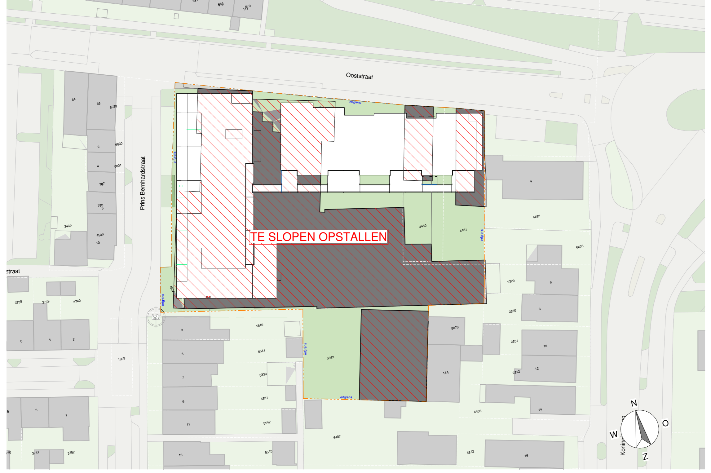
1:500 SITUATIE BESTAAND sloopmelding voor bestaande opstallen wordt op een nader te bepalen tijdstip ingediend