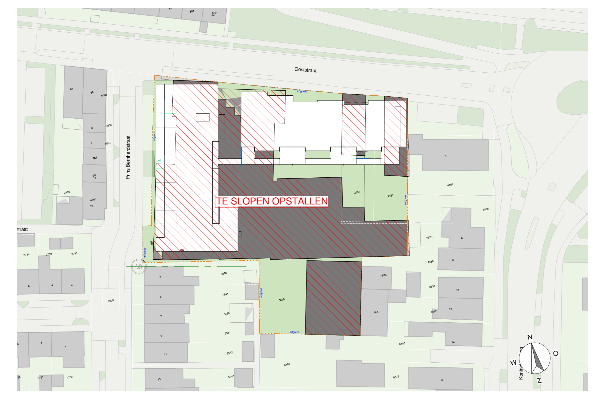
1:500 SITUATIE BESTAAND sloepmelding voor bestaande opstallen wordt op een nader te bepalen tijdstip ingediend